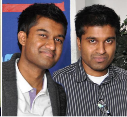
சிறந்த படம் (Exile): Still Life நெல்சன் & குவேரா சிவலிங்கம்

சிறந்த பிரதி: குவேரா & நெல்சன் சிவலிங்கம் - (Still Life) London