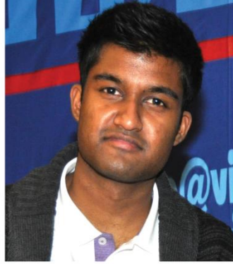
சிறந்த நடிகர் நெல்சன் சிவலிங்கம்