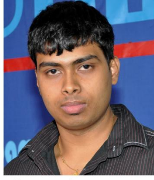
சிறந்த ஒளியமைப்பாளர் வி. ஜனேஷன்